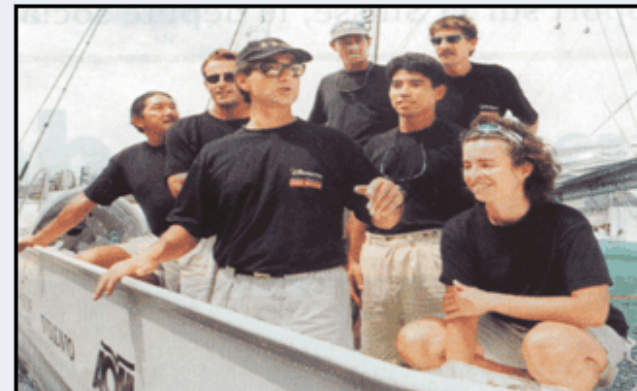
Une partie de l'équipage du catamaran de Loïck Peyron "Innovation-Explorer", The Race 2001